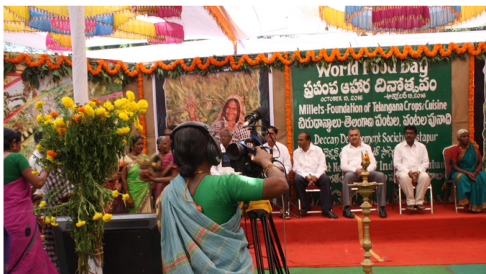
En av kvinnorna i DDS Community Media Trust filmar ett event som organiserats av DDS under World Food Day.

För 15 år sedan fick en grupp dalitkvinnor utbildning i filmskapande med syftet att ge dem en egen plattform för kommunikation där de själva hade kontrollen. Resultatet blev DDS Community Media Trust (CMT), ett kollektiv av kvinnor som tillsammans har producerat över 200 filmer, vunnit nationella priser och även filmat utomlands. Nu är gruppen redo att organisera sin första nationella filmfestival, Jai Chandiram Community Media Trust Film Festival.