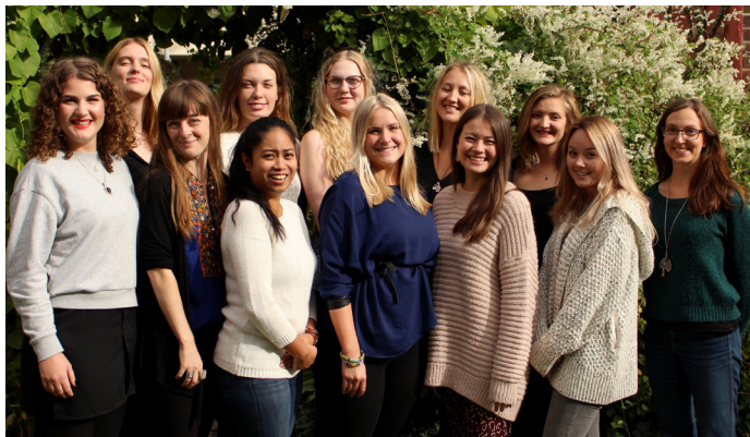
Årets utlandspraktikanter under förberedelserna i Lund.

I början av 2016 återvände de 14 praktikanter som reste ut under hösten 2015. Utöver de 64 blogginlägg de publicerat och 26 artiklar de skrivit under sin praktik gick de under våren i rollen som informatörer för Svalorna och kunde på så sätt stärka kopplingen från partnerorganisationers arbete i Indien och Bangladesh till allmänheten i Sverige. Inom efterarbetet genomförde praktikanterna föreläsningar, skrev artiklar och arrangerade bokcirkel och home parties. Storleken på praktikantgruppen möjliggjorde även större samarbeten så som en fotografiutställning som visades i Lund och Borås, en dokumentärfilm om klimatutmaningar och en podcast i fyra avsnitt. Dessutom producerade praktikanterna tematidningen Kraft med färggranna och starka reportage som trycktes i 600 exemplar.