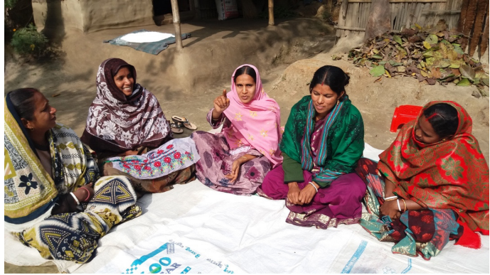
Kvinnor inom en av TSDS kvinnogrupper inom ACCESS diskuterar jämlikhetsfrågor.

samt hälsovårdens förvaltningskommitté. Detta påvisar dynamiska förändringar i form av accepterande, ledarskap och egenmakt utav och hos de fattigaste grupperna, där en ökad representation i de lokala maktstrukturerna har skapat en mer jämlik maktbalans. 8920 medlemmar, utgjord av 27 procent kvinnor, har mottagit regeringens säkerhetsnätstjänster vilket bidrog till att främja beslutfattningsprocessens ansvarighet, öppenhet och demokratiska praxis. Grupperna agerade som garantier för att minska korrupktion, orättvisa och våld mot kvinnor både i projektområdena såväl som i de lokala Shalish, och 193 medlemmar, där kvinnor utgjorde 53 procent, deltog som medlare i Shalish.