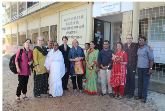
Delar av styrelsen, personal och två praktikanter på besök hos Sabalamby Unnayan Samity (SUS) i Bangladesh.

Liksom tidigare år har styrelsen fått ett flertal möjligheter att träffa och lära känna partners och personalen från kontoren i Indien och Bangladesh, dels genom att delta i den gemensamma arbetsveckan (sedan 2009) i Lund, dels genom möten med representanter från våra samarbetspartners som besökt Sverige till exempel under Glocal Development Talks! Några av styrelsens medlemmar