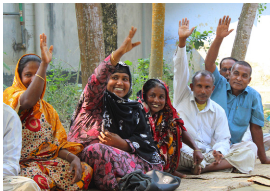
Engagerade deltagare under ettgruppmöte hos TSDS.

Projektet ACCESS – Enhancing Women’s Participation in the Social, Political and Economic Spheres fokuserar på det förtryck och den marginalisering som en stor majoritet av kvinnorna i Bangladesh utsätts för och upplever. Det handlar om att stärka fattiga och landlösa kvinnors tillgång till och deltagande inom sociala, politiska och ekonomiska sfärer och på så sätt bidra till ett jämlikt, rättvist och demokratiskt samhälle. ACCESS arbetar genom bildandet av kvinnogrupper, påtryckningsgrupper och sociala plattformar med fokus på kvinnors rättigheter och att informera om de lagar och sociala skyddsnet som finns. Inom projektet arbetar Thanapara Swallows Development Society (TSDS), Nijera Kori (NK) och Sabalamby Unnayan Samity (SUS) för att stärka kvinnors ledarskap och utrymme, arbeta mot barnäktenskap och genusbaserat våld. Framsteg inom projektet märks genom en ökad acceptans för kvinnors rörlighet och delaktighet i samhället. Från tidigare projektår uppger 51% fler kvinnor att de regelbundet rör sig till offentliga platser som marknader, skolor, sjukhus och lokala festivaler. Samtidigt finns fattigdom och en ökad religiös fundamentalism i arbetsområdena som spär på våldet mot kvinnor. ACCESS-projektet är en del i kampen mot denna trend och för kvinnors lika rättigheter.