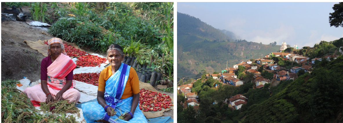
Bilder från Western Chats och Svalornas partnerorganisation Keystone, som är målet för den resa som studiecirkeln avslutas med i Juli.