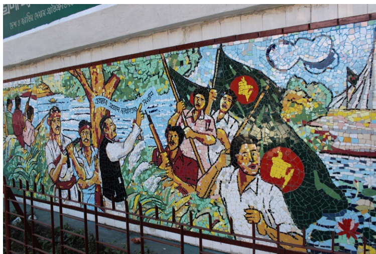
En mosaikvägg i Bangladesh huvudstad, Dhaka, med scener från frihetskriget 1971.

Under året som gått påverkades landets ekonomi och statliga tjänster återigen av stark politisk instabilitet. Efter det kontroversiella regeringsvalet 2014 har oppositionspartiet Bangladesh Nationalist Party (BNP) framfört flera protester och tryckt på för att få till ett nyval. När deras krav på årsdagen av valet inte hade tillmötesgåtts utlyste BNP en rikstäckande trafikblockad som anti-regeringskampanj. Den varade mellan januari och mars månad och blev snabbt våldsam. Hundratals bussar och andra fordon attackerades med brandbomber och många passagerare dödades. Oroligheterna har påverkat hela landet och fått effekter bland annat på klädindustrin som är Bangladeshs största inkomstkälla från export. Svalornas arbete har påverkats och försenats när det gäller fältbesök hos partnerorganisationer och genomförandet av utbildningar.