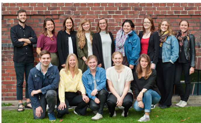
Årets utlandspraktikanter under förberedelserna i Lund.

Svalornas praktikantprogram syftar till att ge unga vuxna erfarenhet av hur Svalornas partnerorganisationer arbetar med internationella utvecklingsfrågor i Indien och Bangladesh. Programmet förbereder praktikanter för ett fortsatt engagemang inom solidaritetsarbete då det ger praktisk kunskap av arbete med utvecklingsfrågor i kombination med Svalornas värdegrund. Att kunna vara en del i ett erfarenhetsutbyte som visar verksamhet och beslut på civilsamhällsnivå är viktigt för Svalorna och blir på så vis ett utbildningsled i folkrörelseperspektiv. Svalorna skickar årligen praktikanter som är mellan 20-30 år gamla till våra partnerorganisationer för praktik i drygt fyra månader.